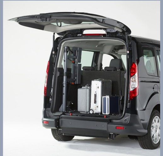
Système Easy-Flex breveté, la rampe se rabat et devient le fond de votre coffre.