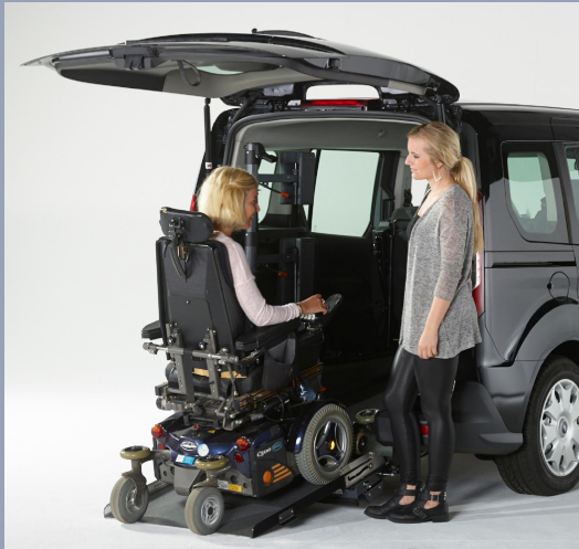
Décaissement du plancher arrière extra long pouvant accueillir les plus grands FR.